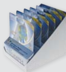
Kartonverpackung in Displaytray