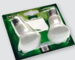
Blister mit verstärktem Euroloch

Transportboxen für Ihr Produkt. Als Komplettanbieter haben wir auch eine Lösung für die Endverpackung.