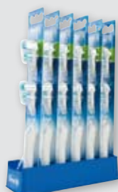
Blisterverpackung in Kunststofftray