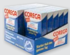
Faltschachteln in Displaybox