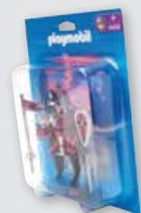
Stehblister mit Innenblister