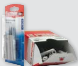
Blisterverpackung und Produktschütze